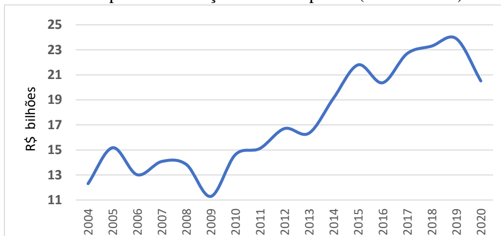
Gráfico 3: Valores da dotação orçamentária dos grupo pessoal e encargos para a subfunção ensino superior (2004 – 2020)

Congresso Nacional e prevê a redução salarial dos servidores públicos, pois se não há orçamento terá de haver redução de salários.